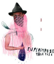
CD: Superimpose „Talk Talk“, Leo Records, 2010